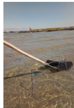
Figura 1.- Toma de mostraxas no banco de O Sarrido

As mostraxes dos bancos marisqueiros da área de explotación da Confraría de Cambados cunha periodicidade semestral, de acordo coa importancia do banco, nivel de datos dispoñibles, etc., en coordinación cos Biólogos de Zona da delegación comarcal de Carril.