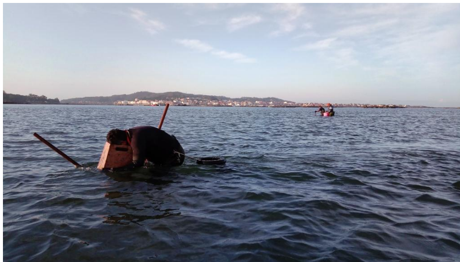
Figura 2.- Mostraxe de forquilla i espello no banco marisqueiro de solénidos nas Means.