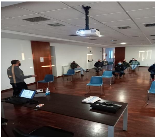
Figura 3. Xornada formativa

Unha xornada formativa-divulgativa do proxecto, foi realizada o 12 de Xaneiro de 2021 no salón de actos da Confraría.